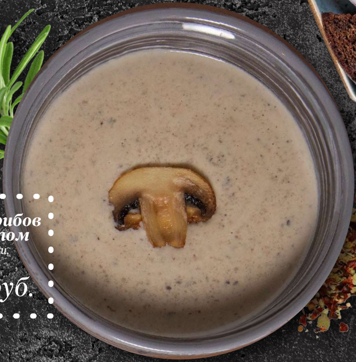
Крем суп из белых грибов с трюфельным маслом (Белые грибы, картофель, сливки, трюфельное масло, морковь) 470 руб.