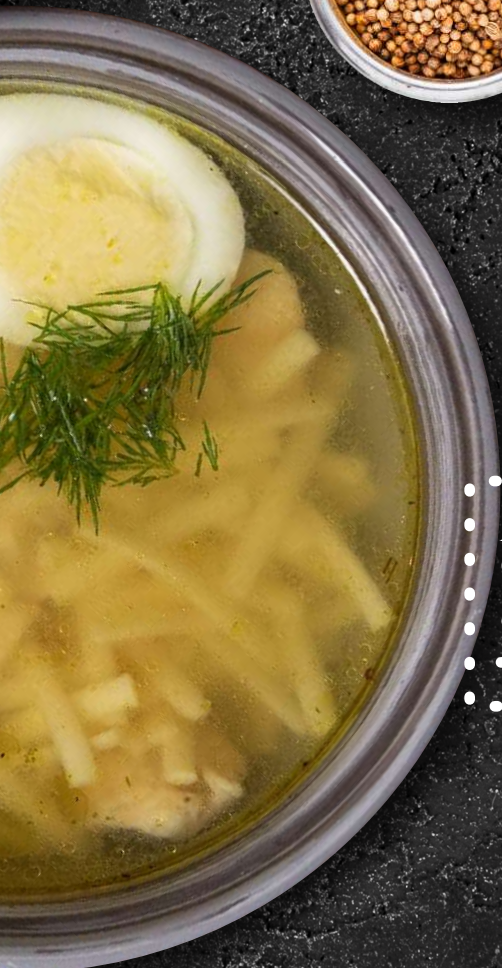
Куриный бульон с домашней лапшой (Куриное филе, домашняя лапша, отварное яйцо) 390 руб.